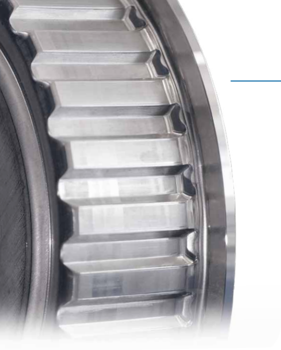
Blechteil von aussen an einen Bund umgeformt.