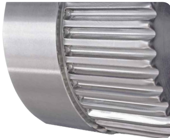
Vollmaterial bis zum Bund verzahnt.