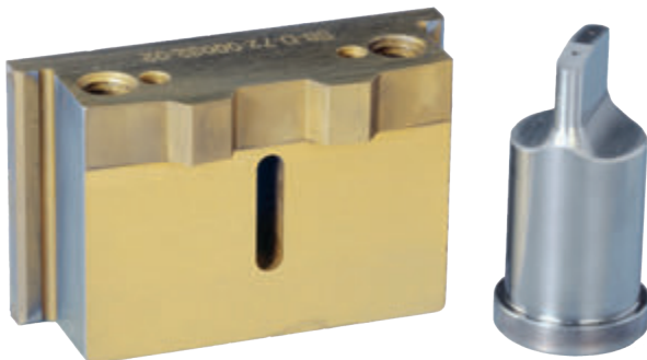
スロツティング用ツール

深い専門知識のもとに、最先端の工具製作設備と高い技術を持ったやる気溢れる技術チームと製造スペシャリストたちがお客様の特定のアプリケーションに最適なツールを最短納期でお届けすることが可能です。